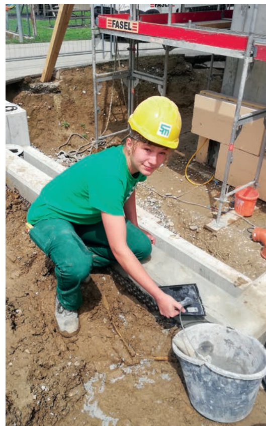
Chantier à la salle communale de Cugy

Non, à mon avis, il y a des métiers où les femmes seront plus adeptes que les hommes et vice versa. Toutefois cela n'empêche pas à une femme de s'intéresser par exemple au métier de maçon, tout le monde peut faire un métier qui lui plaît.