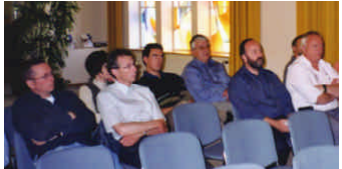
Participants au séminaire

L e 30 avril dernier, une vingtaine de personnes ont suivi avec intérêt, dans les locaux du Centre de formation Professionnelle et Sociale du Château de Seedorf, le workshop consacré à la création simple d'un site Internet. Un outil de travail informatique en ligne, développé par la société Novasys à Lausanne, permet, sur la base de modèles existants, de créer très rapidement un site pour