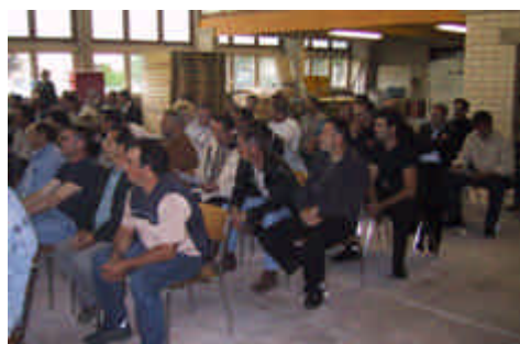
Halle des maçons

C'est aussi lui, son titre l'indique, qui mène les hommes, qui donne le rythme. C'est donc en