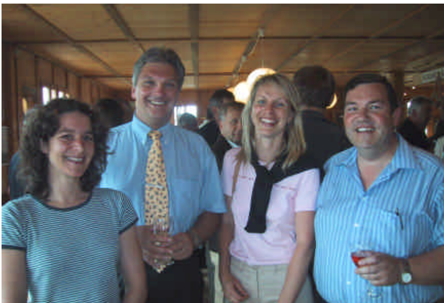
Le personnel du secrétariat durant l'apéritif à Vully Expo

Après cet intéressant exposé, les invités et les membres de la Fédération, les membres d'honneur et vétérans se sont rendus en car sur le Mont Vully. Depuis le lieu de l'apéritif, on pouvait voir au loin, d'un côté l'Arteplage de Morat avec son monolithe bien visible devant la ville et de l'autre côté l'Arteplage de Neuchâtel. Un ensemble de deux musiciens, dans un